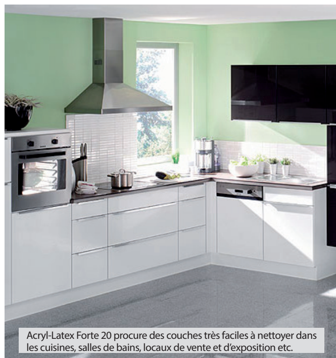
Acryl-Latex Forte 20 procure des couches très faciles à nettoyer dans les cuisines, salles de bains, locaux de vente et d'exposition etc.

Dispersion PUR d'un finish extraordinaire, sans odeur, avec une excellente résistance à l'abrasion et au lavage et un nettoyage très facile.